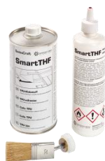
Difuplan WELD Quellschweißmittel