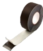
Difuplan EKB A 60