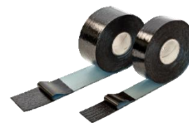
NB, NDB Nageldichtband

Druckfehler, Irrtümer und technische Änderungen vorbehalten!